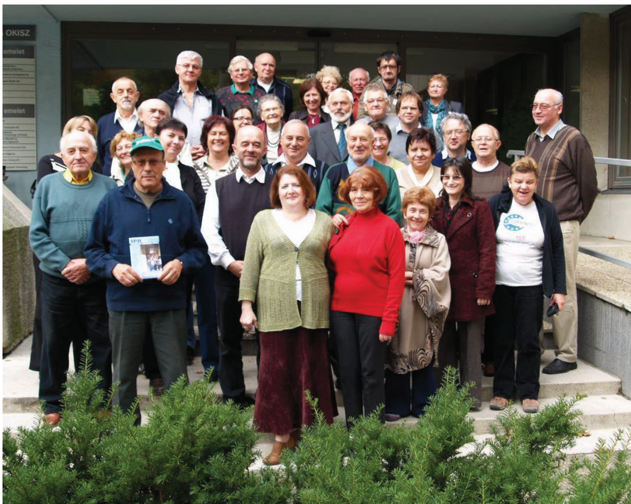
Partoprenantoj de la Pedagogia Tago de ILEI-HU (25 Oktobro 2014, Budapest)