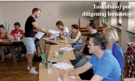
Taskofolioj por diligentaj lernantoj

I e en mia subkonscio tamen silente dormetis la espero, ke eble mi mian tutan surteran vivon ne pasigos per tuttaga sidado en la oficejo. Verdire, tiu imago de ĉiutaga rutino timigadis min.