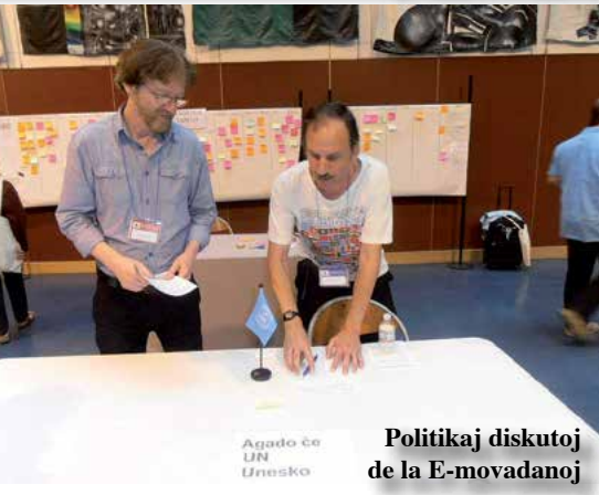
Politikaj diskutoj de la E-movadanoj