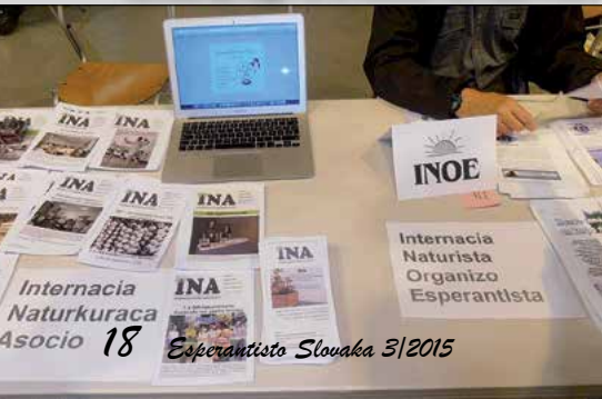
18 Esperantista Slovaka 3/2015

de la lingva politiko en EU,“ kiun por la unua fojo partoprenos politikistoj, lingvaj fakuloj kaj reprezentatoj de civitanoj kaj „Internacia Entreprenista kaj Komerca Forumo“, aŭspiciata de Miroslav Lajčák, la vicprezidanto de la registaro kaj ministro de eksterlandaj kaj eŭropaj aferoj de Slovaka respubliko. La tria aranĝo estos „Interreligia Renkontiĝo de la Representantoj de Diversaj religioj,“ kiu estos grava kontribuado dum la prezidanteco de Slovaka Respubliko en la Konsilantaro de EU en la tempo de la kreskanta interetna, interkultura kaj interreligia streĉo, konfliktoj igantaj ksenofobion, ekstremismom, rifuzon kaj timon de la civitanoj de EU sub la influo de la nekontrolita alveno de granda nombro de nelegalaj enmigrantoj.