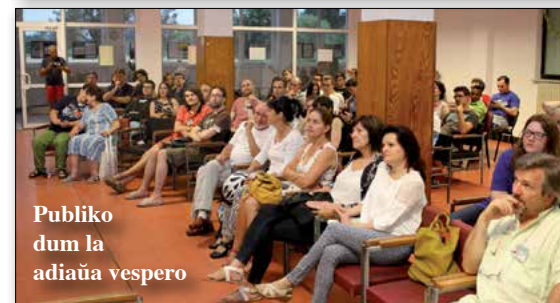
Publiko dum la adiaŭa vespero