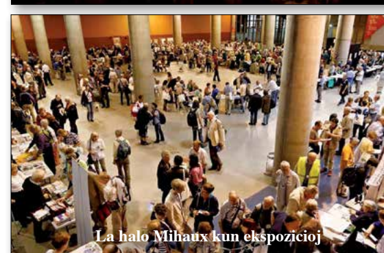
La halo Mithau kun ekspozíciój