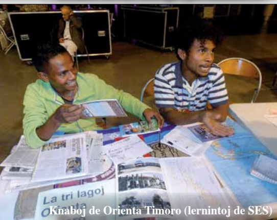
Knaboj de Orienta Timoro (lernintoj de SES)