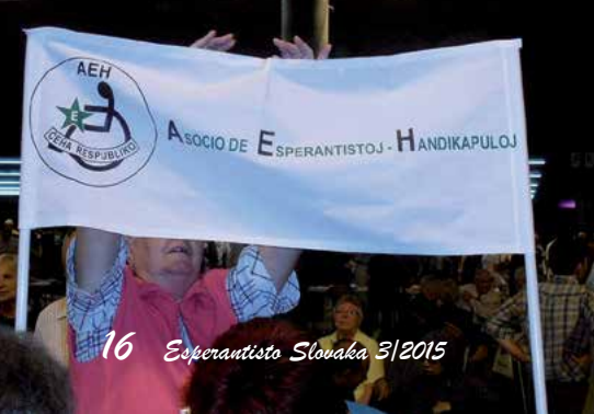
16 Esperantisto Slovaka 3/2015

Dum la tuta semajno Slovakio havis inform-standon en la kongresejo. Ĝi estis preparita kunlabore kun Slovaka agentejo por turismo (SACR), la urbo Nitra, Slovacia Esperanto-Federacio, civitana asocio Edukado@Interreto kaj aliaj institucioj. En la stando haveblis diversaj informmaterialoj pri Slovakio, Nitra, la kongreso kaj akompanantaj aranĝoj, diversaj reklam-materialoj (ekzemple Slovaka ĉokolado Lyra, kiu venkis en la monda konkurso de ĉokoladoj en la jaro 2014). Multaj partoprenantoj en Lillo aliĝis al la Universala Kongreso en Nitra.