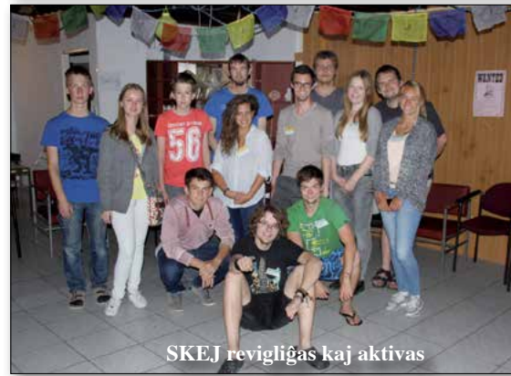
SKEJ revigliĝas kaj aktivas