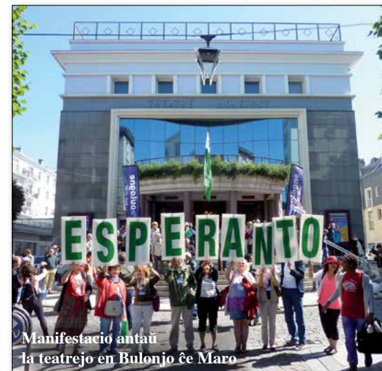
Manifestacio antaŭ la teatrejo en Bulonjo ĉe Maro