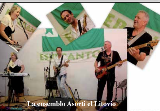
La ensemblo Asorti el Litovio