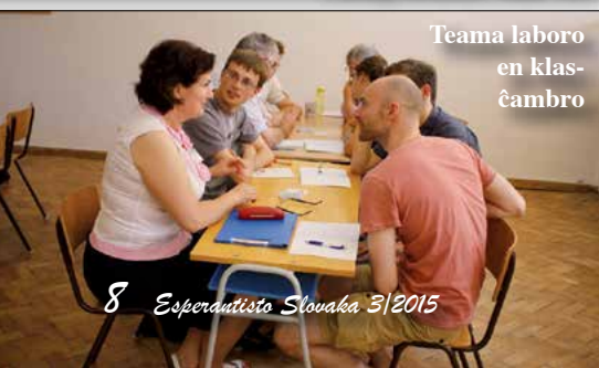
Teama laboro en klasĉambro

da sekundoj, kaj ekde la unua sekundo mi sentis, ke mi ĝin trovis. Mi aliris la aferon tiel, ke mi lernos ion novan, eble mi kun iu babilos, kaj se mi enuos, mi iros hejmen, aŭ bierumi kun amikoj.