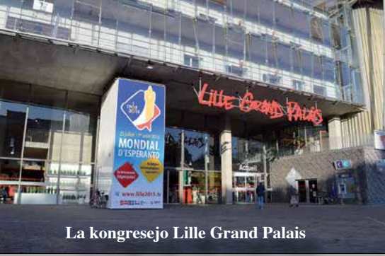
La kongresejo Lille Grand Palais