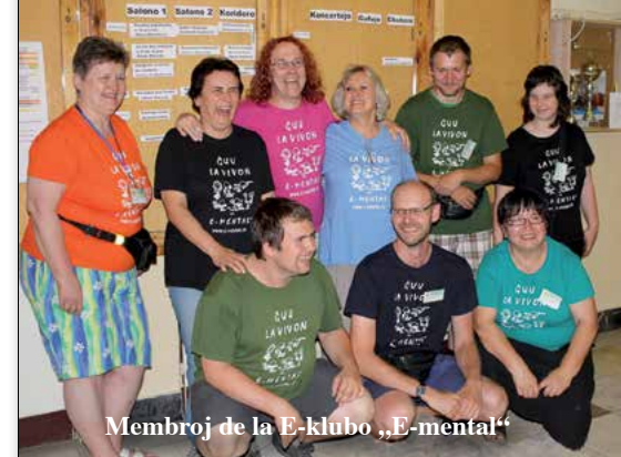
Membroj de la E-klubo „E-mental“

Internet je nekonečný a veril som, že mi ponúkne možnosť zmeny, možnosť zmysluplného strávenia času mimo práce, počas dovolenky. Nespomínam si, čo presne som hľadal a za čím som šiel, objavil som však jedno nadchádzajúce podujatie, ktoré sa malo konať neďaleko odo mňa, s ľuďmi z celého sveta, ponúkajúce možnosť nadobudnutia znalostí esperanta.