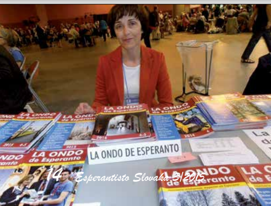
14 Esperantisto Slovaka 3/2015

La kongreso inkludis ankaŭ la 68-an Internacian Kongresan Universitaton, kie profesoroj kaj akademianoj de universitatoj el Brazilo, Ĉeĥio, Ĉinio, Finnlando, Francio, Israelo, Germanio, Rusio, Hispanio, Italio kaj Usono pridiskutis rilatajn temojn el diversaj sciencaj fakoj en la kunteksto de la heredaĵo de Ludoviko Zamenhof. Ili volis ne nur pritaksi la nunan situacion, sed proponi ankaŭ iujn prognozajn elirpunktojn.