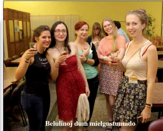
Belulinoj dum mielgustumado