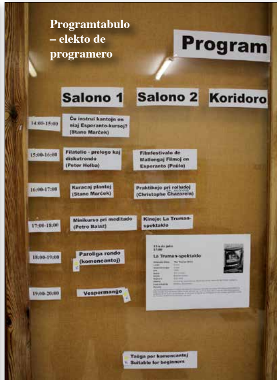
Programtabulo – elekto de programero