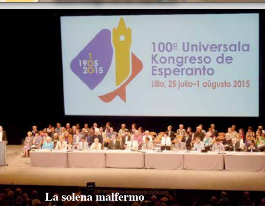
La solena malfermo