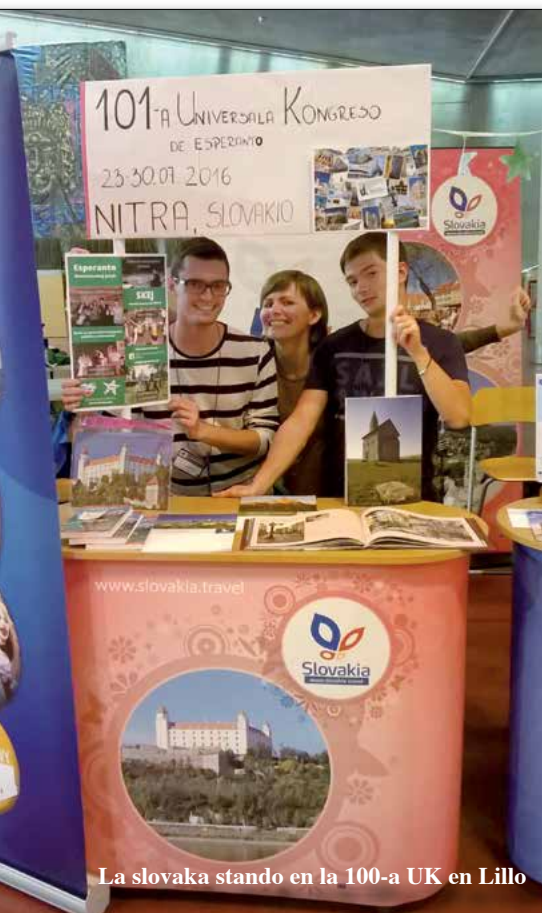
La slovakia stando en la 100-a UK en Lillo

Tiu ĉi someron mi estis plena de atendoj post SES (Somera Esperanto-Studado) en Martin, kaj mi iris al la Universala Kongreso en Lillo. Mi havis multajn kialojn por iri tien. Unue mi volis ekkoni novan urbon, kaj due, ke tio estis mia unua granda kongreso. Sed la plej