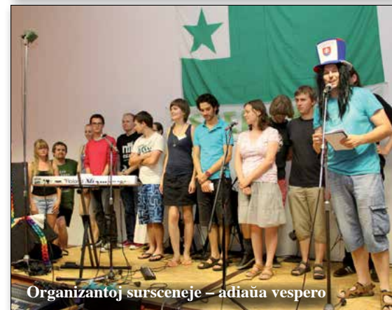
Organizantoj sursceneje – adiaŭa vespero