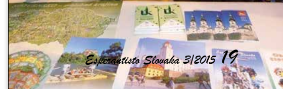
Esperantista Slovaka 3/2015 19