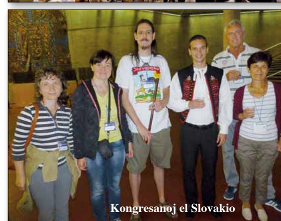
Kongresanoj el Slovakio