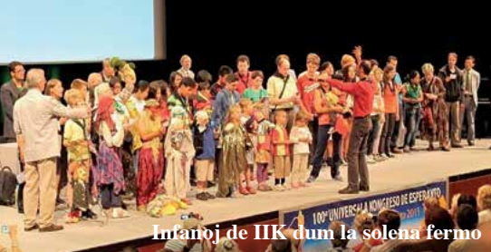
Infanoj de IJK dum la solena fermo