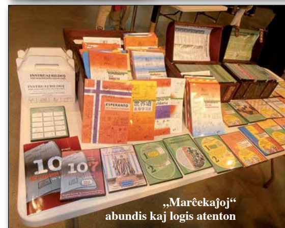
„Marčekajoj“ abundis kaj logis atenton