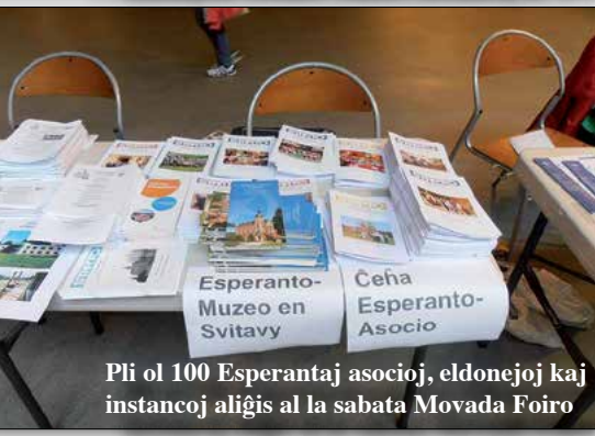
Pli ol 100 Esperantaj asocioj, eldonejoj kaj instancoj aliĝis al la sabata Movada Foiro