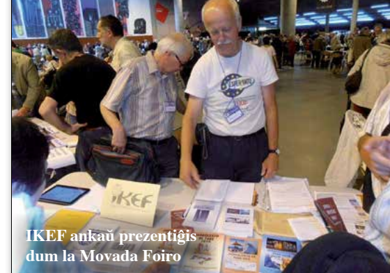
IKEF ankaŭ prezentiĝis dum la Movada Foiro

Predsedníctvo Svetovej esperantskej asociácie na zasadnutí v Lille pri posudzovaní kandidatur Montrealu a Soulu na organizovanie ďalšieho svetového kongresu rozhodlo, že sa 102. svetový kongres Esperanta v roku 2017 uskutoční v Soule. Kórea, Soul a organizátori