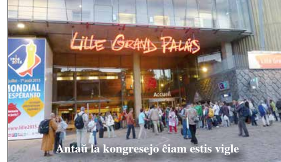
Antaŭ la kongresejo ĉiam estis vigne

100. svetový kongres Esperanta sa niesol v znamení prezentácie Slovenska, ako budúcej hostiteľskej krajiny. Na základe rozhodnutia