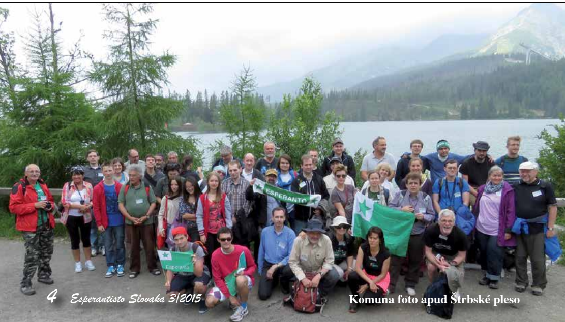
4 Esperantisto Slovaka 3/2015

Uplynulých dvadsaťštyri rokov môjho života som stihol preŝť viacerými obdobia mi a v ĉase odchodu zo ŝkoly s vedomím, ŝe mi začína ŝivot beŝného dospeláka, som sa zmieril so svojim osudom pomaly slepnúĉeho a priberaĝúĉeho programáтора.