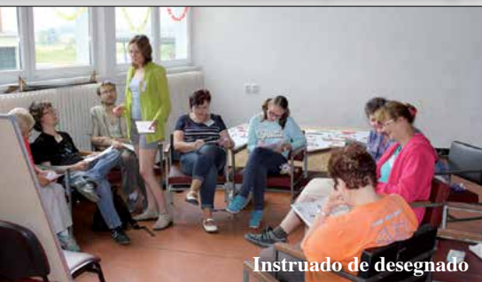
Instruado de desegnado