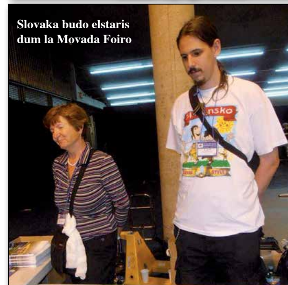
Slovaka budo elstaris dum la Movada Foiro