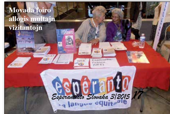
Movada foiro allogis multajn vizitantojn