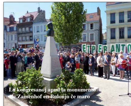
La kongresanoj apud la monumento de Zamenhof en Bulonjo ĉe maro