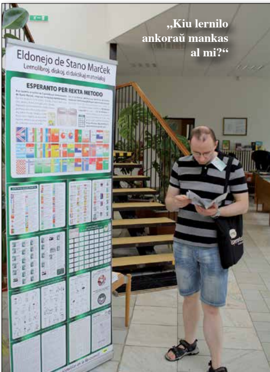
„Kiu lernilo ankoraŭ mankas al mi?“