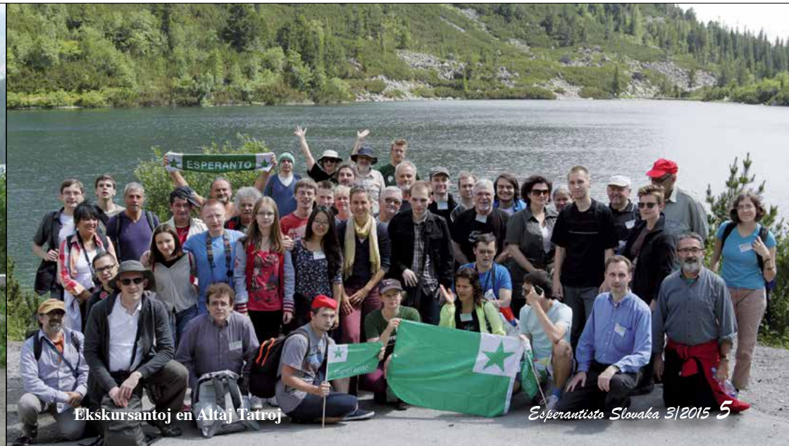
Ekskursantoj en Altaj Tatroj