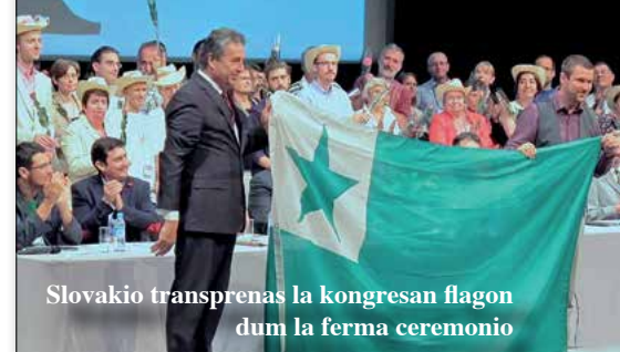
Slovakio transprenas la kongresan flagon dum la ferma ceremonio