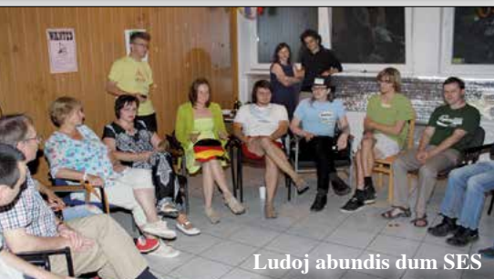
Ludoj abundis dum SES