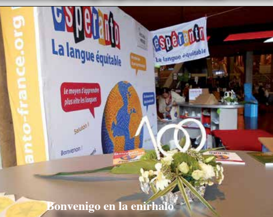
Bonvenigo en la enirhalo