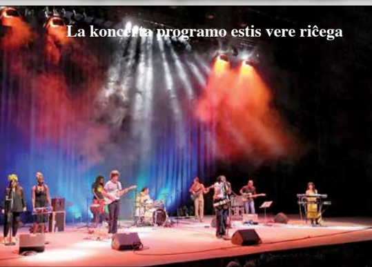
La koncerta programo estis vere riĉega