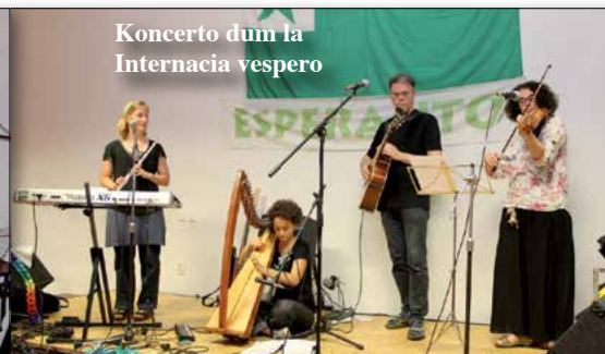
Koncerto dum la Internacia vespero