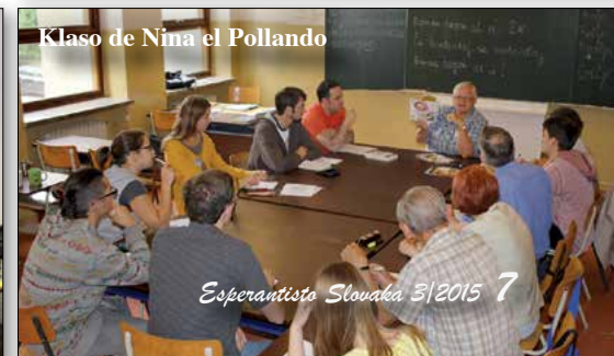
Klaso de Nina el Pollando