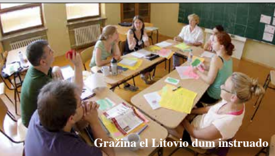
Grazina el Litovio dum instruado