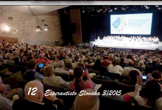
12 Esperantisto Slovaka 3/2015