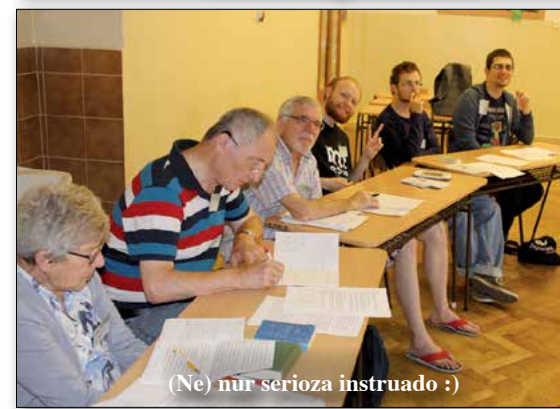
(Ne) nur serioza instruado :)