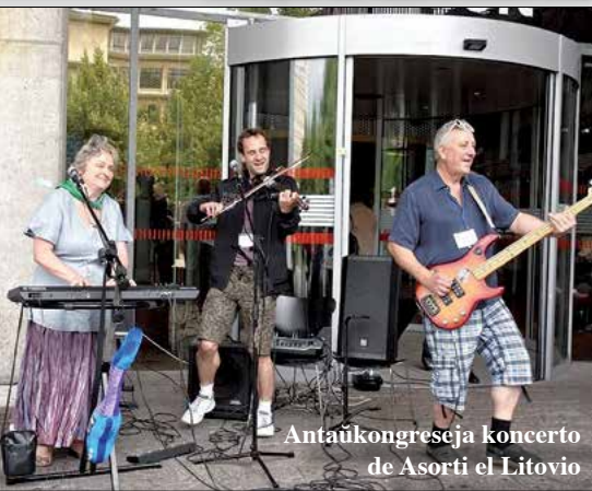
Antaŭkongreseja koncerto de Asorti el Litovio