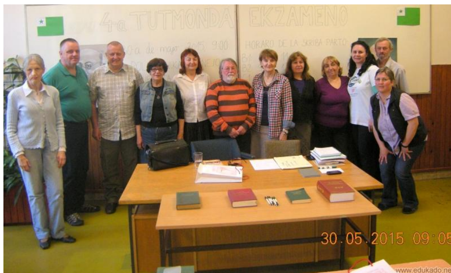
Kuna fotoĵo antaŭ la ekzameno