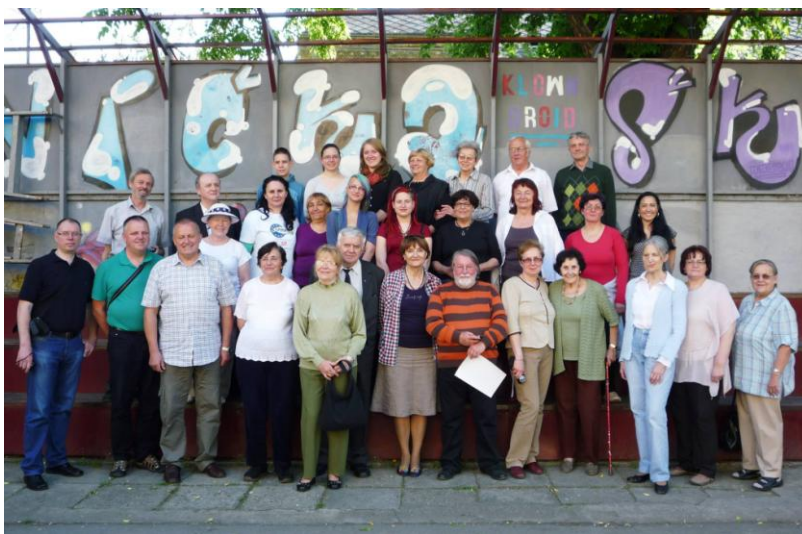
Fina pozado de ĝeamikoj