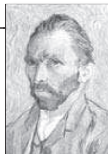
Vincent van Gogh (1853-1890)